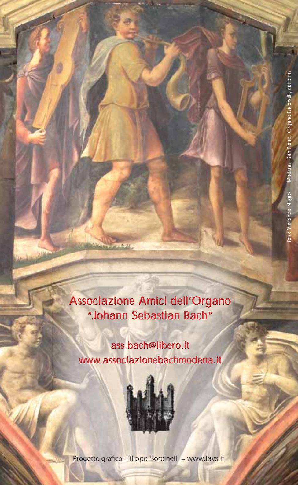
Modena, San Pietro, Organo Facchetti, cantoria